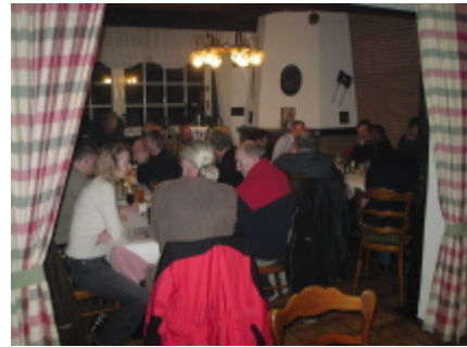
Der Laden ist voll!

Alle waren sich einig, dass die Besichtigung der Zaadnordijk-Werft eine besonders beeindruckende Veranstaltung war, da wir einen umfangreichen und detaillierten Einblick in die Schiffsproduktion erhielten.