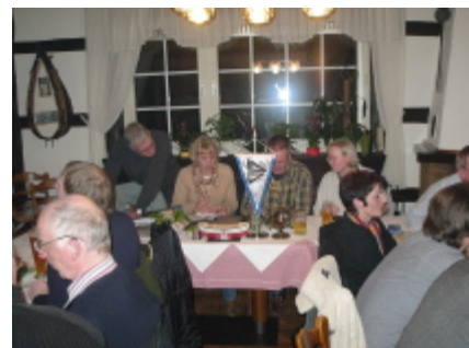
Unser Vorstand mit dem neuen Teuto-Yachting Kneipen-Wimpel.

Alles in Allem eine schöne Veranstaltung. Vielen Dank an unseren fleißigen Vorstand!