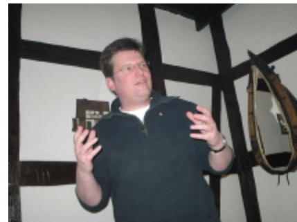
Geballte Überzeugungskraft strömt auf die Zuhörer ein.

Alles in Allem eine schöne Veranstaltung. Vielen Dank an unseren fleißigen Vorstand!